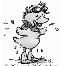
DLRG Jugend OV-Gochsheim

(während der Bay. Schulferien findet kein Training statt)